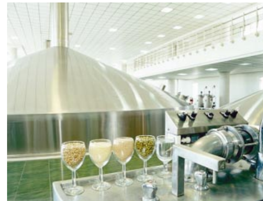
Olla de cocimiento en la actualidad.

Al inicio de la fase de cocción se añade el lúpulo para alterar el sabor, y al final se vuelve a hacer un añadido con el fin de dotar al líquido de aroma. En la inyección del lúpulo, su compuesto amargo experimenta cambios como producto del estado hirviente del mosto, proceso denominado isomerización. En esta etapa del proceso se busca fundamentalmente esterilizar el mosto, aprovechar la función del lúpulo, aglutinar las moléculas de alta densidad, a fin de que no lleguen a la etapa ulterior de fermentación, y obtener el grado deseado de concentración de azúcares para el mosto. En la olla de ebullición, el proceso general del cocimiento dura un número variable de