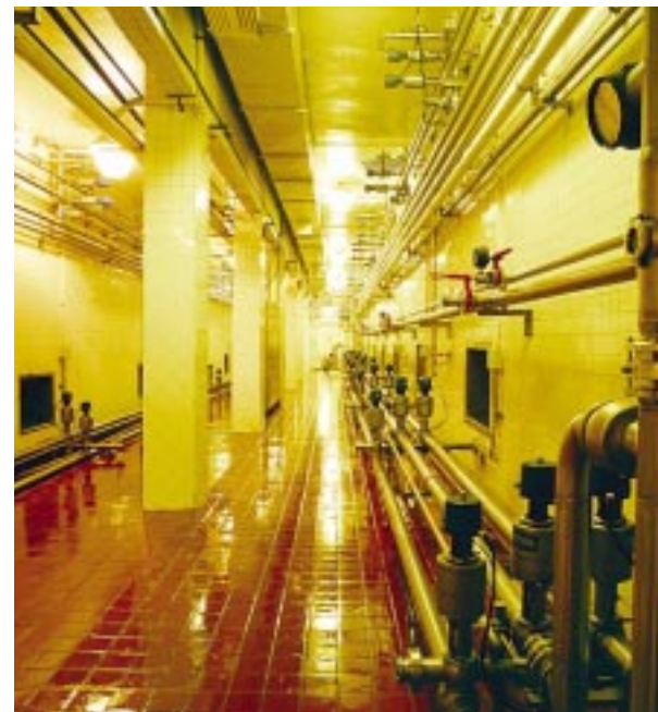
Nevera para el envejecimiento.