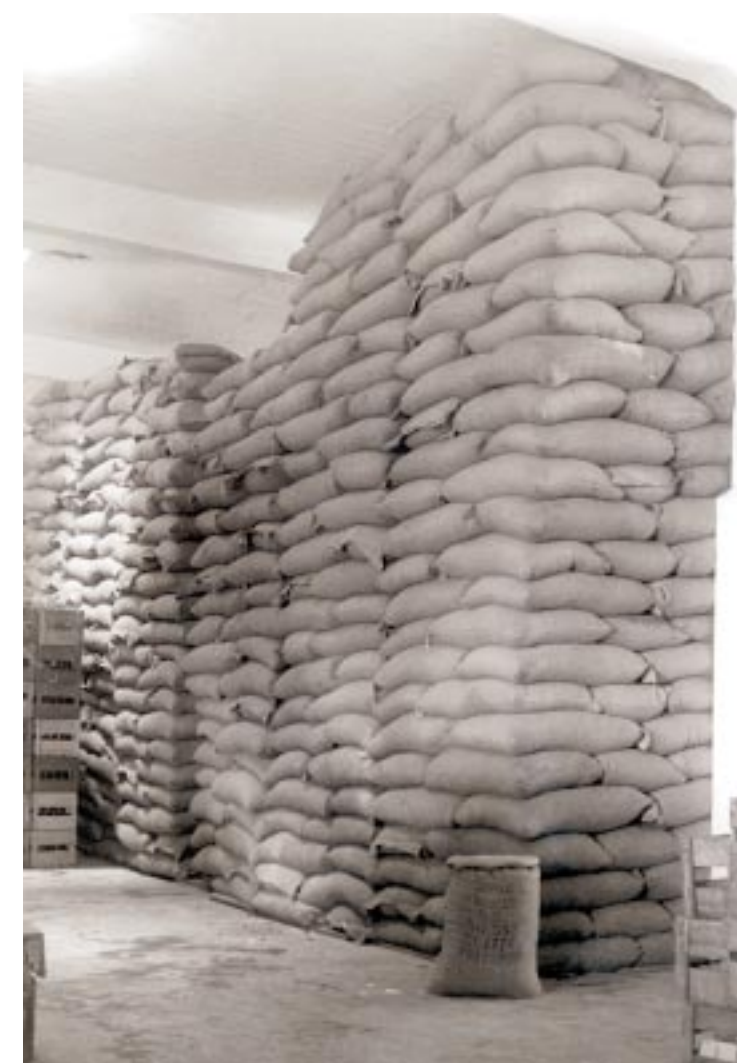
Depósito de malta de la CND. Década de 1930.

No obstante la dependencia de una determinada materia prima para el producto deseado, el malteado se lleva a cabo de manera independiente del resto del proceso. Esto se debe en gran medida a que el cereal requiere ser sometido con prontitud al malteado, por lo cual constituye una operación previa, con sus peculiaridades y exigencias. La gran mayoría de empresas cerveceras, por consiguiente, prefieren prescindir de la fase del malteado, que queda en manos de plantas especializadas, y adquirir la malta en el mercado, materia prima con la cual propiamente comienza la labor de la cervecería.