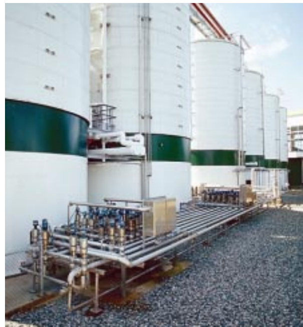
Tanques para fermentación.

horas, dependiendo de los equipos de la sala de cocimiento y la tecnología empleada en el proceso. A veces en esta etapa se añaden otros ingredientes para contribuir al sabor y al aroma deseados. Este mosto queda esterilizado y no puede permitirse que entre en contacto con el aire. Por la misma razón, el tránsito del mosto al enfriador debe llevarse a cabo mediante conductos rigurosamente aislados de contacto con el aire. La búsqueda de una temperatura apta para el efecto ulterior de la levadura conlleva un enfriamiento súbito del mosto, para llevarlo a temperaturas oscilantes entre 10 y 15 grados centígrados. El papel de este enfriador es preparar el mosto para que reciba la inyección de levadura, pues de otra manera, como ser vivo, esta moriría por exceso de temperatura. En esta etapa de tránsito al fermentador, tras el enfriado del mosto, se inyecta aire estéril y la levadura, con el fin de iniciar el proceso de fermentación.