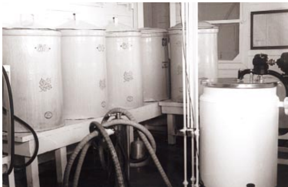
Posible propagador de levadura. Década de 1940.

tas operaciones. Esta fase dura varias horas, dependiendo del método empleado y se conoce con el término de maceración. Termina obteniéndose un mosto azucarado, contenido de sustancias solubles. Anteriormente el movimiento de esta solución se llevaba a cabo con las manos o con largos instrumentos de madera, pero con la invención de maquinarias en el siglo XIX hubo una sustitución por aspas movidas por motores. Al finalizar este proceso de obtención del mosto, se separan los residuos sólidos por medio de un filtrado. Los residuos de esta filtración, llamados granos exhaustos, se colectan y generalmente se aprovechan como alimento para animales.